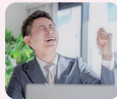
モチベーションアップ講座