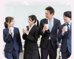
コミュニケーション